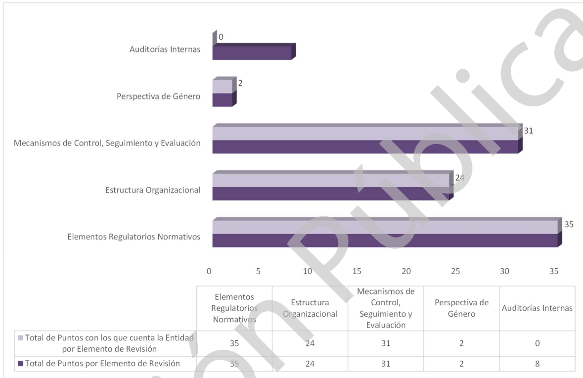
Grafica 1 Cumplimiento de los Mecanismos de Control Interno Ejercicio 2020